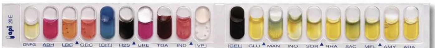
Document 3 : La notion d'espèce chez les bactéries.

La reconnaissance des différentes espèces passe par des tests biochimiques colorés vérifiant la capacité à utiliser une ressource du milieu. L'API 20E comprend une bande en plastique contenant 20 mini-puits de test. Chaque puits contient des milieux avec des compositions chimiquement définies pour détecter généralement une activité enzymatique précise, liée à un métabolisme. Chaque métabolisme bactérien est différent.